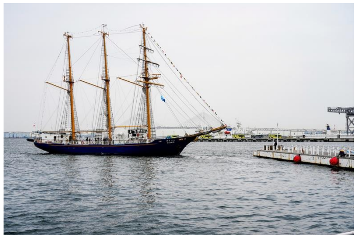
ぷかり桟橋では、「帆船みらいへ」の体験乗船会が行われた