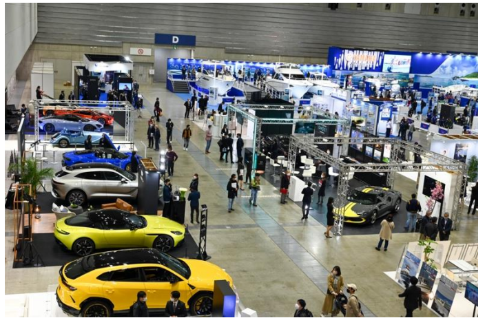
ライフスタイルアベニューではラグジュアリーカーを中心に