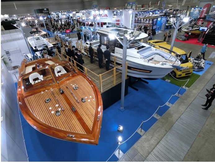
パシフィコ会場にはボート・PWC・スモールボート等約100隻台が展示