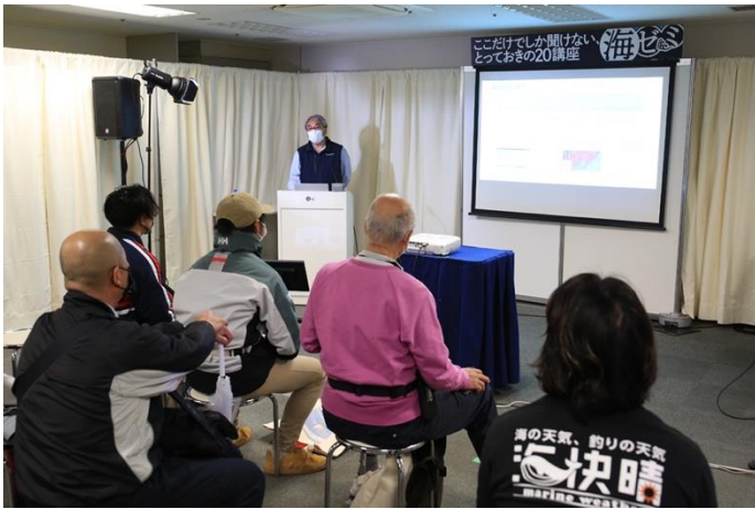
「海ゼミ」ではリアルとライブのハイブリッド視聴を実施