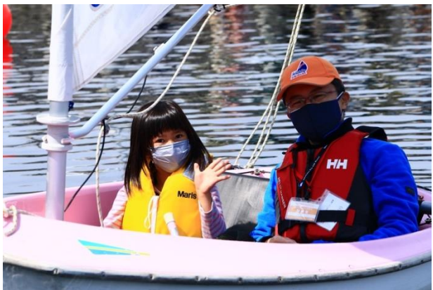
元気な子供たちで賑わいを見せたキッズ体験