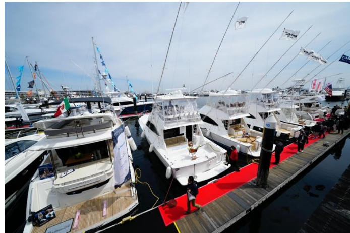
横浜ベイサイドマリーナ会場では30フィート以上の大型艇を係留展示