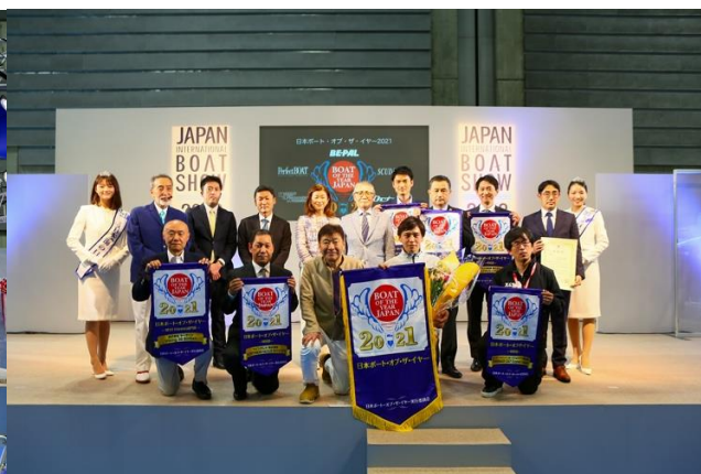
ボート・オブ・ザ・イヤーは、AXOPAR37 XC CROSS CABINを選出