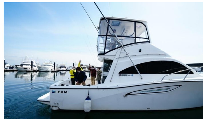
毎年人気の体験プログラム。今年は4種が予定通り行われた

■媒体名 ■お名前を明記いただき、eメールをお送りください。 E-mail: kouhou@boatshow.jp