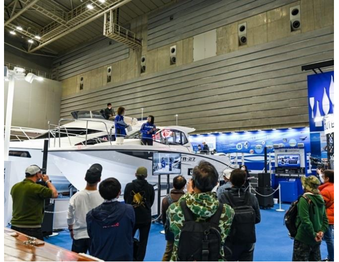
出展社のブースでもさまざまなイベントが行われた