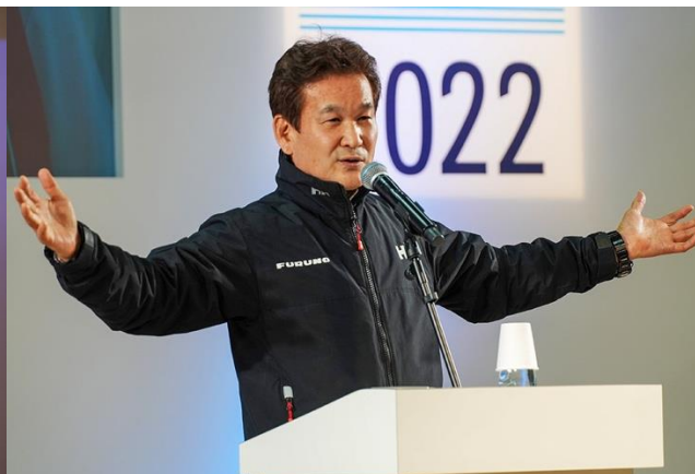
太平洋単独往復横断を果たした辛坊治郎さんのトークライブ